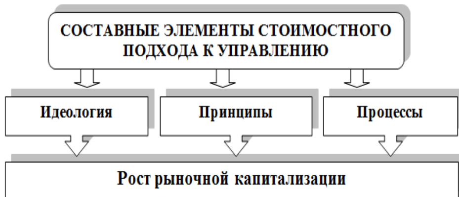
Рисунок 2 – Методы оценки эффективности корпоративного управления.

тегии. Процесс, как устойчивая и целенаправленная совокупность взаимосвязанных действий, определяет эффективность организации в реализации стратегии и достижении поставленных целей, направленных на рост рыночной капитализации корпорации.