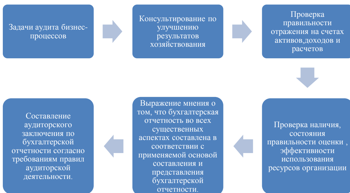
Рисунок 1 – Задачи аудита бизнес–процессов

С целью выявления причин недостаточно эффективной работы организации, нами разработаны задачи аудита бизнес–процессов организации, которые представлены на рисунке 1.