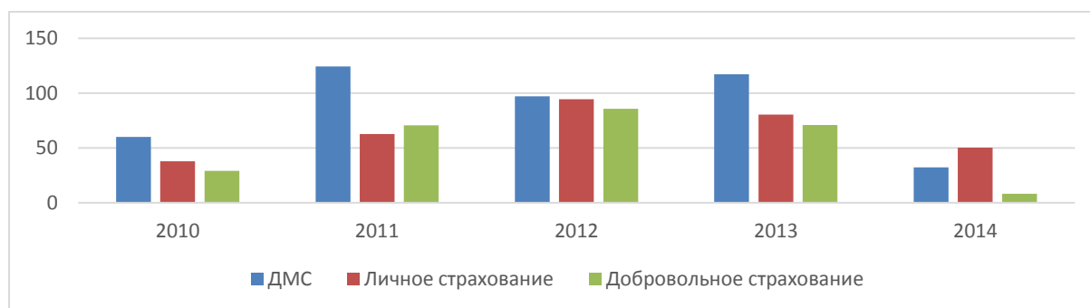
Рисунок 3 – Темпы прироста премий по добровольному страхованию в целом, по личному страхованию и ДСМР

Добровольное страхование медицинских расходов продолжает набирать популярность, и с каждым годом спрос только растет. В 2014 году данный вид занял 14,1 % портфеля добровольного личного страхования. Темпы прироста собранных взносов по добровольному медицинскому страхованию за анализируемый период значительно опережают темпы прироста взносов по личному страхованию и по добровольным видам страхования в целом. В 2011 году наблюдалось наиболее значительное превышение темпов прироста сектора ДСМР над секторами добровольного и личного страхования, что было обусловлено нестабильной экономической обстановкой и девальвацией белорусского рубля [2].