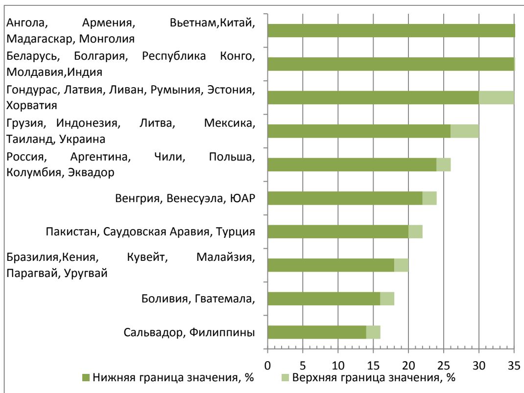
Рисунок 2 – Уровень нормы накопления в переходных и развивающихся экономиках

По данным рисунка 1 видно, что наименьший процент нормы накопления среди развитых стран у Великобритании, который составляет от 16 до 18 процентных пункта. Большая часть стран с развитой экономикой, таких как Гонконг (Китай), Греция, Дания, Ирландия, Италия, Люксембург, Мальта, Нидерланды, Финляндия, Швейцария, имеют норму накопления от 20 до 22%. Наибольшее значение нормы накопления среди данной группы стран у Южной Кореи, Словении и Сингапура, оно составляет 30–35 процентных пунктов.