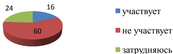
Рисунок 2 – Заинтересованность администрации города в развитии спортивной индустрии

Жители г. Владивостока считают, что администрация города мало уделяет внимание развитию спортивной индустрии (60%), а заслуга в развитии физической культуры и спорта принадлежит различным спортивным Федерациям и предпринимателям (рисунок 2).