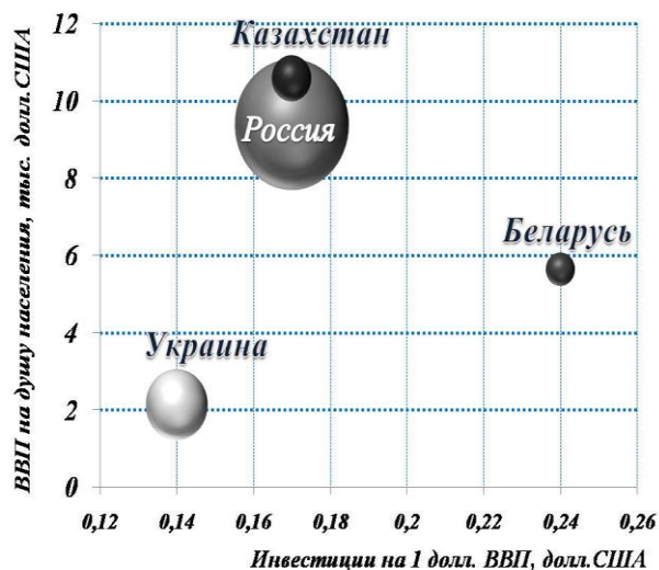
Рисунок 2 – Сравнительная оценка уровня структурных инвестиций в национальных экономиках

Примечание – составлено автором по данным Федеральной службы государственной статистики России, Национального статистического комитета Республики Беларусь, Комитета по статистике Министерства национальной экономики Республики Казахстан, Государственной службы статистики Украины