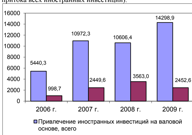
Рисунок 1 – Привлечение иностранных инвестиций на валовой основе в 2006-2009 гг., млн. долл.

Так, в 2009 г. на валовой основе по всем направлениям инвестиций (прямые, портфельные, другие) в страну было привлечено 14 298,9 млн. долл., что на 34,8% меньше чем за 2008 г. (рис. 1). В свою очередь, валовой объем привлеченных ПИИ снизился на 31,2% и составил 2 452,6 млн. долл. (17,2% от валового притока всех иностранных инвестиций).