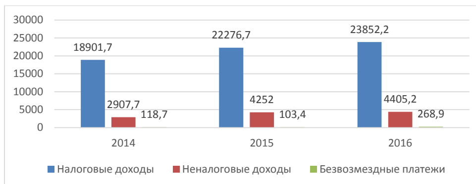
Рисунок 1 – Структура доходов консолидированного бюджета за 2014 – 2016 гг.

Доходная часть консолидированного бюджета Республики Беларусь формируется, главным образом, за счет налоговых поступлений. Структуру доходов можно рассмотреть на рисунке 1 (млн. руб).