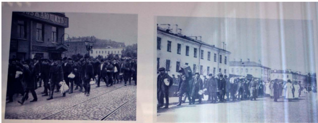
Пачатак Першай сусветнай вайны. Мабілізацыя у Петраградзе, 1914 г.

Але адносіны Аляксандра Блока да дадзеных падзей кардынальна адрозніваліся. Як паэт-сімваліст, ён у глыбіні душы прадбачыў і адчуваў тыя вялікія беды, якія можа прынесці вайна ўсім народам, успрымаў сусветную бойню як жудасную нечалавечую праяву. У гэты час, маючы славу лепшага паэта Расіі, ён з глыбокім смуткам рэагаваў на пачатак вайны, імкнуўся пазбегнуць мабілізацыі на фронт. Не таму, што адчуваў сябе баязліўцам, а таму, што вайна яму бачылася з’явай антынароднай. І ў адрозненне ад многіх вядомых тагачасных пісьменнікаў і паэтаў Аляксандр Блок быў свабодны ад шавіністычнага ўгару і псеўдапатрыятызму [4, с. 134].