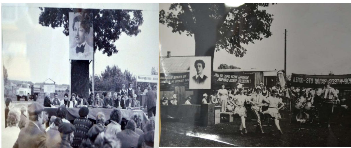
Мероприемствы, прысвечанныя А. Блоку ў вёсках Лапацін, Калбы

Такім чынам, выказваецца павага і ўдзячнасць паэту, творчасць якога належыць не толькі расійскай літаратуры, але і ўсёй сусветнай культуры. Ведаць і любіць паэзію Блока – гэта значыць яшчэ больш паважаць і любіць сваю родную літаратуру, сваю паэзію, свой народ.