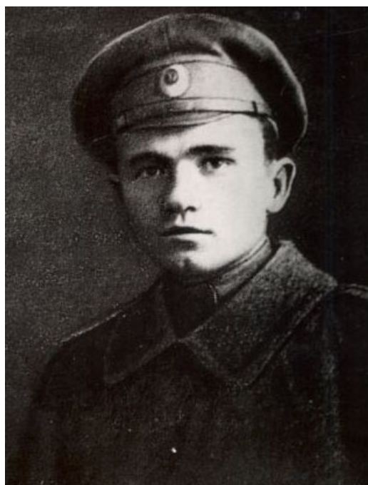
Аляксандр Блок і Максім Гарэцкі у Парахонску, 1916 г.

У Парахонску і прайшла большая частка з тых 200 дзён, што Блок правёў на Палессі. Вядома, што ў гэты час у дадзенай вёсцы таксама служыў вядомы беларускі пісьменнік Максім Гарэцкі. Але ці перасякаліся хоць нейкім чынам шляхі-дарогі беларускага і расійскага класікаў літаратуры на Піншчыне застаецца невядомым. Тым не менш, ёсць звесткі, што ў Парахонску, а таксама ў некаторых іншых прыфрантавых населеных пунктах, сяляне звярталіся з хадатайніцтвам да кіраўніцтва Усерасійскага саюза зямель і гарадоў з мэтай адкрыцця народных школ. У такіх зваротах падкрэслівалася, што “Школа і пісьменнасць неабходныя ім і іх дзецям як важнейшы сродак пазбаўлення ад цемнаты і невуцтва, як найпершая жыццёвая патрэба”[10]. Магчыма, што ў Парахонску падобныя звароты ажыццяўляліся дзякуючы станоўчым адносінам да гэтай справы як Блока, так і Гарэцкага. Жыў паэт у фальварку князя Друцкага-Любецкага. Менавіта тут, у Парахонску Аляксандр Блок сустрэў сваё 36-годдзе. Тую палову жыцця, якая па яго меркаваннях была “самая цяжкая”. Вядома, што з гэтай