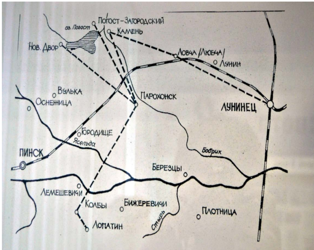
Блокаўскія мясціны на Палессі