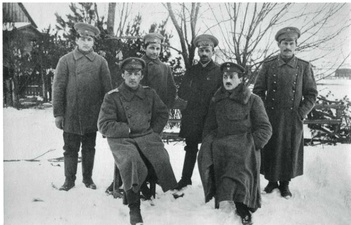
Аляксандр Блок са сваімі таварышамі

11 жніўня 1916 г. у складзе інжынерна-будаўнічага атрада паэт быў накіраваны ў вёскі Лапаціна і Калбы, дзе вялося будаўніцтва запасных пазіцый для расійскіх войск і