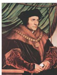
Т. Мор. Художник Х. Хольбейн Младший. 1524 г.

«Визуальный поворот» в обучении истории определяет новые требования и подходы в использовании наглядно-иллюстративного материала в новых учебных пособиях по истории. Иллюстрация теперь не может рассматриваться только как визуальное сопровождение учебного текста, она должна выполнять функции полноценного информативного исторического источника познания прошлого. Перед авторами школьных учебников стоит задача разработки такого методического аппарата, который позволит реализовать визуальному источнику эти функции. На примере нового учебного пособия по всемирной истории (к созданию которого автор имеет непосредственное отношение) и учебного пособия по истории Беларуси для 7 класса, выпущенных в Республике Беларусь в 2017 г. можно проследить существенные изменения в использовании визуальных источников.