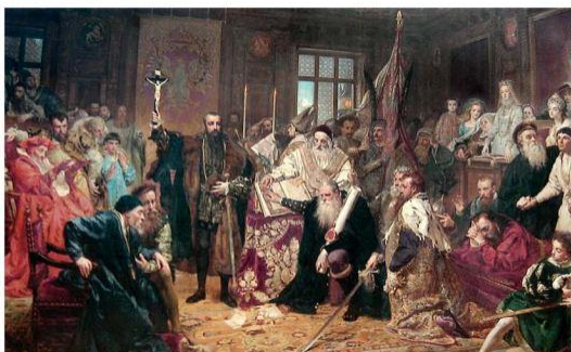
Люблинская уния. Художник Я. Матейко. 1869 г.

Использование иллюстративного ряда в учебном пособии по истории Беларуси для 8 класса 2010 г. при изучении темы «Образование Речи Посполитой» (с. 12).