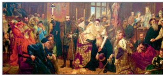
▲ Люблинская уния. Художник Я. Матейко. XIX в.

2. Обсудите, какой момент Люблинского сейма отражен на картине. Где, по вашему мнению, изображены представители Княжества? Как автор передает их отношение к унии?