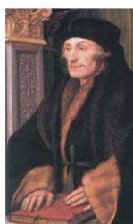
Эразм Роттердамский. Художник Х. Хольбейн Младший. 1523 г.