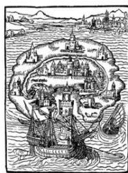
Остров Утопия. Иллюстрация к книге Т. Мора «Утопия». 1516 г.