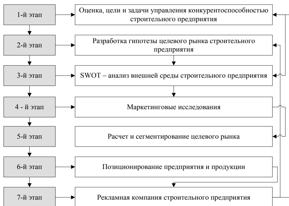
Рисунок 1 – Процесс разработки комплекса маркетинговых мероприятий в рамках маркетинговой стратегии, [составлено на основе 4, с. 112-119; 9, с. 491]

Процесс разработки комплекса маркетинговых мероприятий в авторской методике представлен на рис. 1.