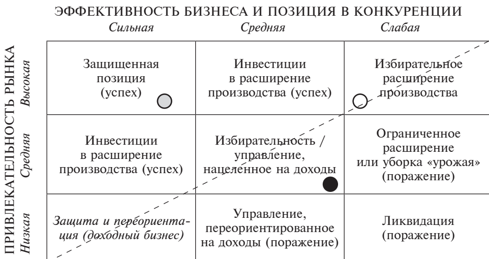
Рис. 2. Состояние текущего портфеля бизнес-единиц строительного предприятия [7, с. 37]

В последние годы в результате действия многочисленных социальных, экономических, организационных, экологических, психологических факторов сформировался стабильный спрос на индивидуальное комфортабельное, обеспеченное соответствующей инфраструктурой жилье по относительно доступной цене.