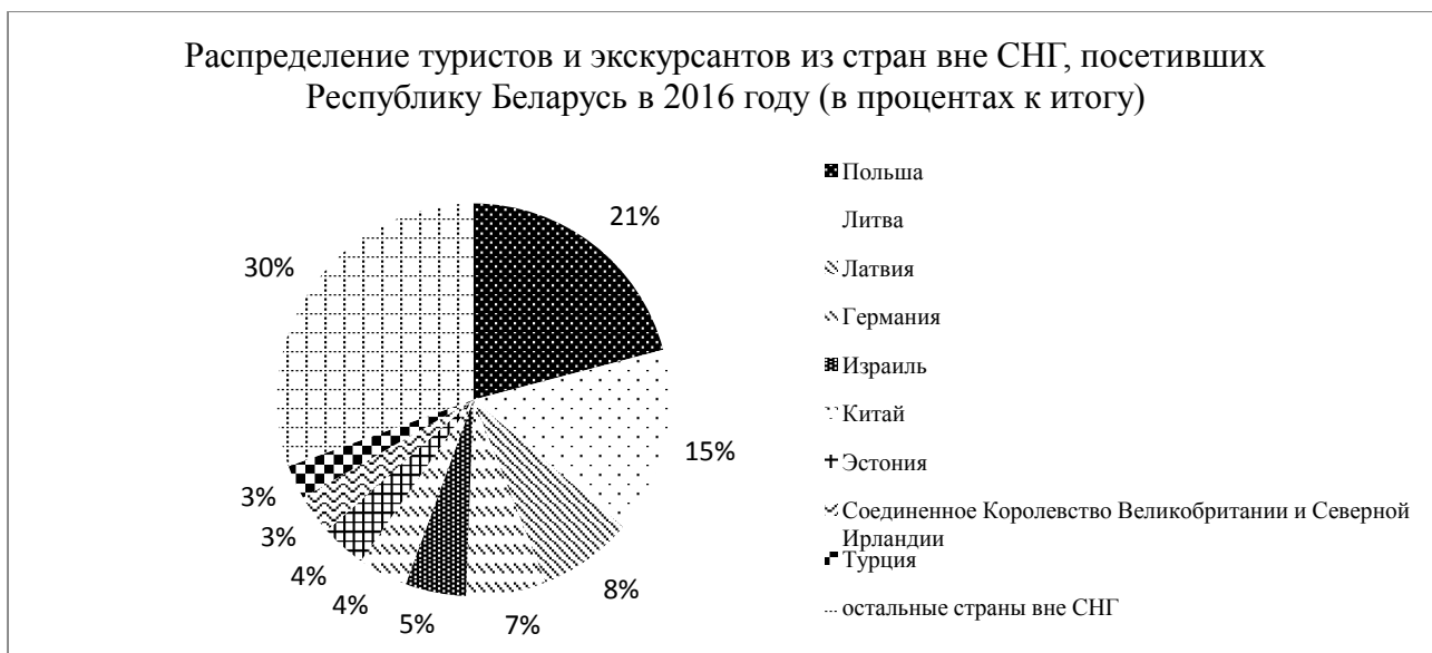
Рис. 2. Численность туристов, посетивших РБ и выехавших за рубеж в 2016 году

Основными направлениями выездного туризма являются Российская Федерация, Республика Болгария, Турция, Украина, Египет, Республика Польша, Испания, Черногория. Распределение туристов и экскурсантов, выехавших из Республики Беларусь в 2016 году (в процентах к итогу) можно увидеть на рис. 3.