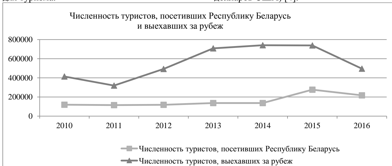
Рис. 1. Численность туристов, посетивших РБ и выехавших за рубеж

Статистика посещения Республики Беларусь туристами из разных стран свидетельствует об увеличении количества туристических прибытий практически в 2 раза (2010 год – 120 073 чел., 2016 – 217 398 чел., темп роста 181,0 %). Удельный вес туристов из стран СНГ составляет: в 2010 году – 69,4%, в 2016 году – 82,4%, туристов из стран вне СНГ: в 2010 году – 30,6%, в 2016 году – 17,6%. Количество выехавших за рубеж также возросло (2010 год - 414 735 чел., 2016 год – 495 727 чел., темп роста – 119,5%). Удельный вес туристов из стран СНГ составляет: в 2010 году – 38,1%, в 2016 году – 23,8%, туристов из стран вне СНГ: в 2010 году – 61,9%, в 2016 году – 76,2%. Наглядно тенденции посещения страны и выезда граждан за рубеж демонстрирует рис. 1. Объем экспорта туристических услуг в 2014 году составил 251,3 млн. долларов США при плане 360 млн. долларов США (2010 год – 146,7 млн. долларов США) [4].