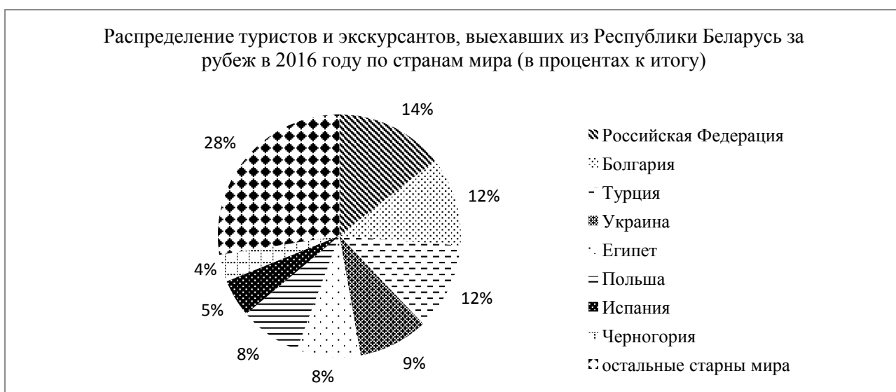
Рис. 3. Численность туристов, посетивших РБ и выехавших за рубеж в 2016 году

Региональная концентрация туристов в Республике Беларусь различна. Наибольший удельный вес приходится на г. Минск (55,4 %) [4], среди областей лидирующую позицию занимает Брестская область. Однако, имеются тенденции к изменению, децентрализации туристических потоков и направления их в регионы.