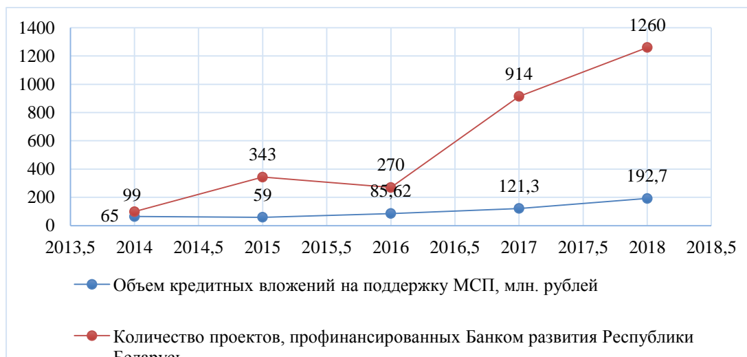
Рисунок 2 – Основные показатели БР РБ по поддержке МСП

Данные цифры наглядно представлены на графике.