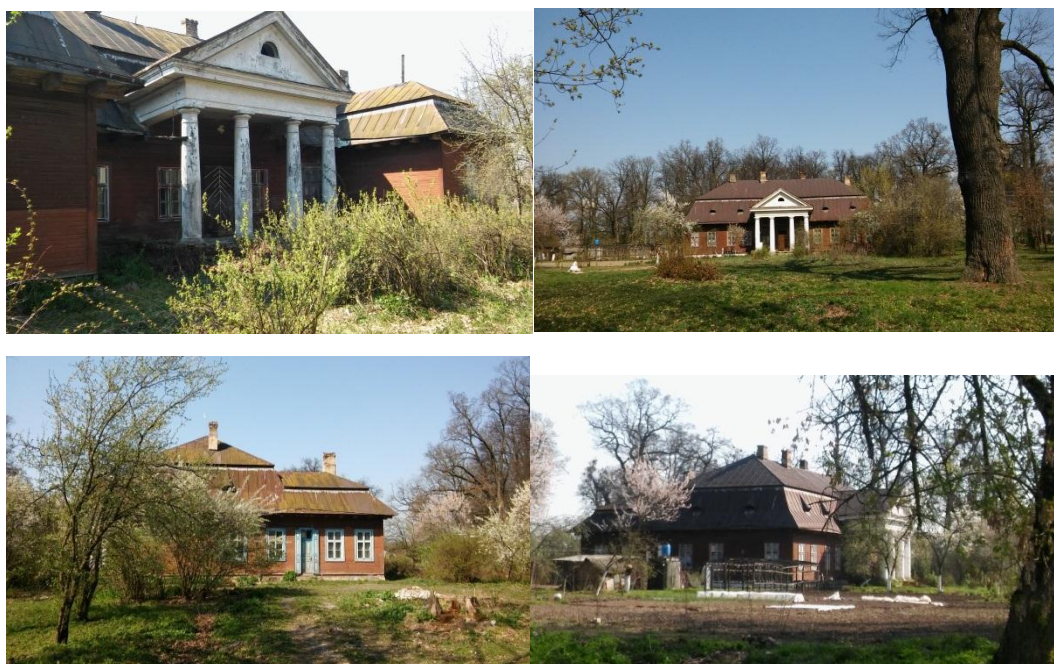
Рисунок 2 – Усадебный дом (современное состояние)

Проведенная инвентаризация зеленых насаждений свидетельствует о довольно скудном видовом разнообразии парка. Ученные нами 359 объекта дендрологической флоры представлены 15 видами, относящимися к одному отделу Magnoliophyta , 4 подклассам, 8 порядкам, 11 семействам и 14 родам (таблица 1).