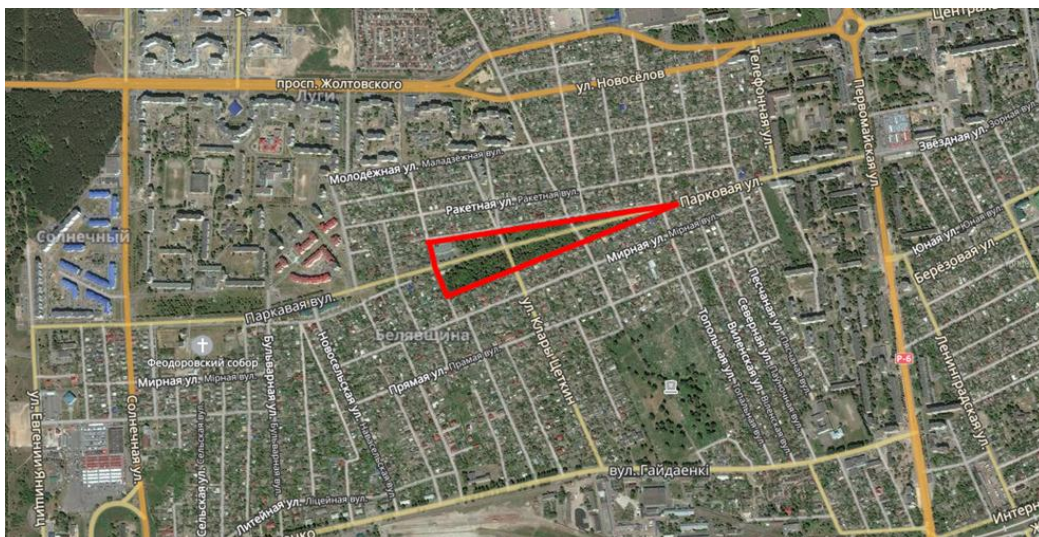
Рисунок 1 – Границы исследуемой территории

Древесно-кустарниковые насаждения представлены хвойными и лиственными древесными растениями, из которых преобладают ясень обыкновенный ( Fraxinus excelsior ) (197 шт.), орех грецкий ( Juglans regia ) (45 шт.), клен ясенелистный ( Acer negundo ) (39 шт.), конский каштан обыкновенный ( Aesculus hippocastanum ) (37 шт.), вяз шершавый ( Ulmus glabra ) (28 шт.), робиния ложноакациевая ( Robinia pseudoacacia ) (28 шт.). А также встречаются такие виды, как дуб черешчатый ( Quercus robur ), липа мелколистная ( Tilia cordata ), береза повислая ( Betula pendula ).