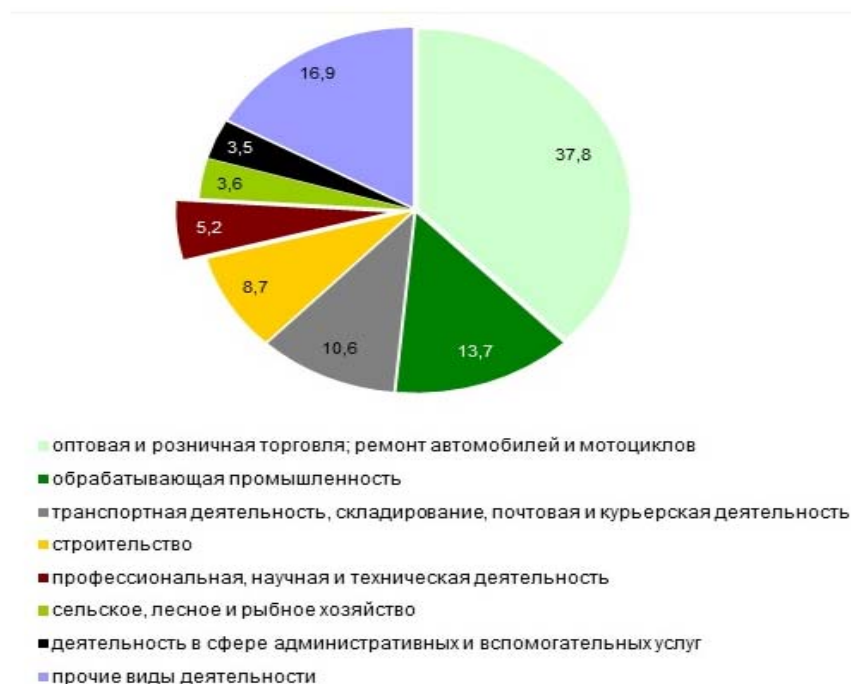
Рисунок 1 - распределение количества микроорганизаций и малых организаций по видам экономической деятельности за 2016 год

Проанализируем распределение количества микроорганизаций и малых организаций по видам экономической деятельности за 2016 год (рисунок 1).