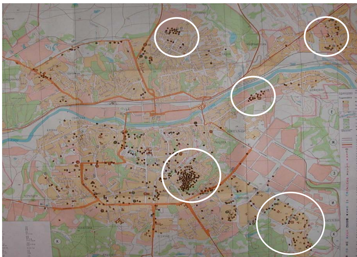
Рис. 1. Распределение детей с бронхиальной астмой по регионам города Смоленска.

При анализе распределения детей, страдающих бронхиальной астмой, по регионам города Смоленска, была составлена электронная карта, на основании которой выявлены экологически неблагоприятные территории, характеризующиеся высоким процентом проживания пациентов с данным заболеванием (рис. 1).