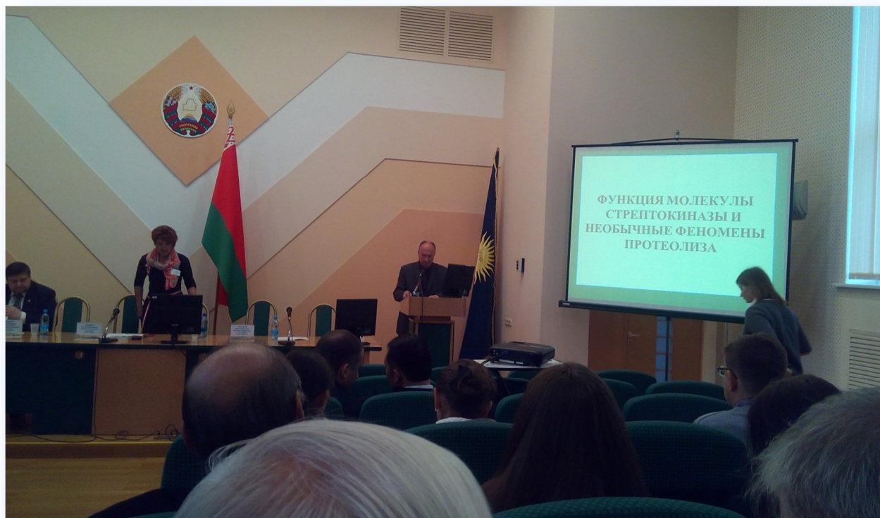
Пленарное заседание Международной научно-практической конференции «Современные проблемы естествознания в науке и образовательном процессе», Минск, октябрь 2015 г.