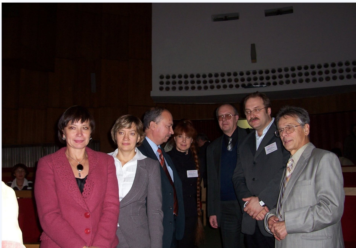
Пленарные докладчики международной конференции, Минск, 25-26 октября 2007 г.