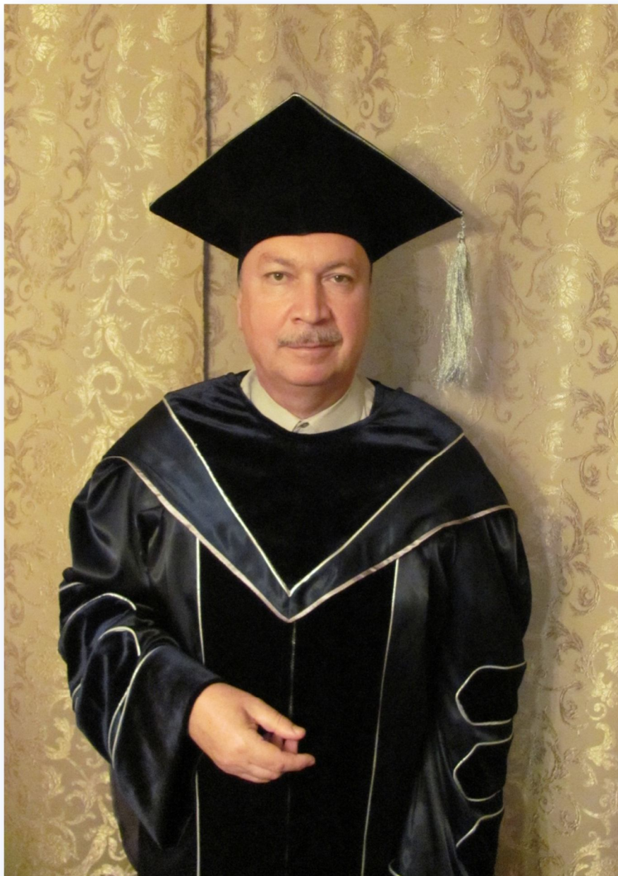
Почетный профессор Витебской государственной академии ветеринарной медицины (ноябрь 2013 г.)