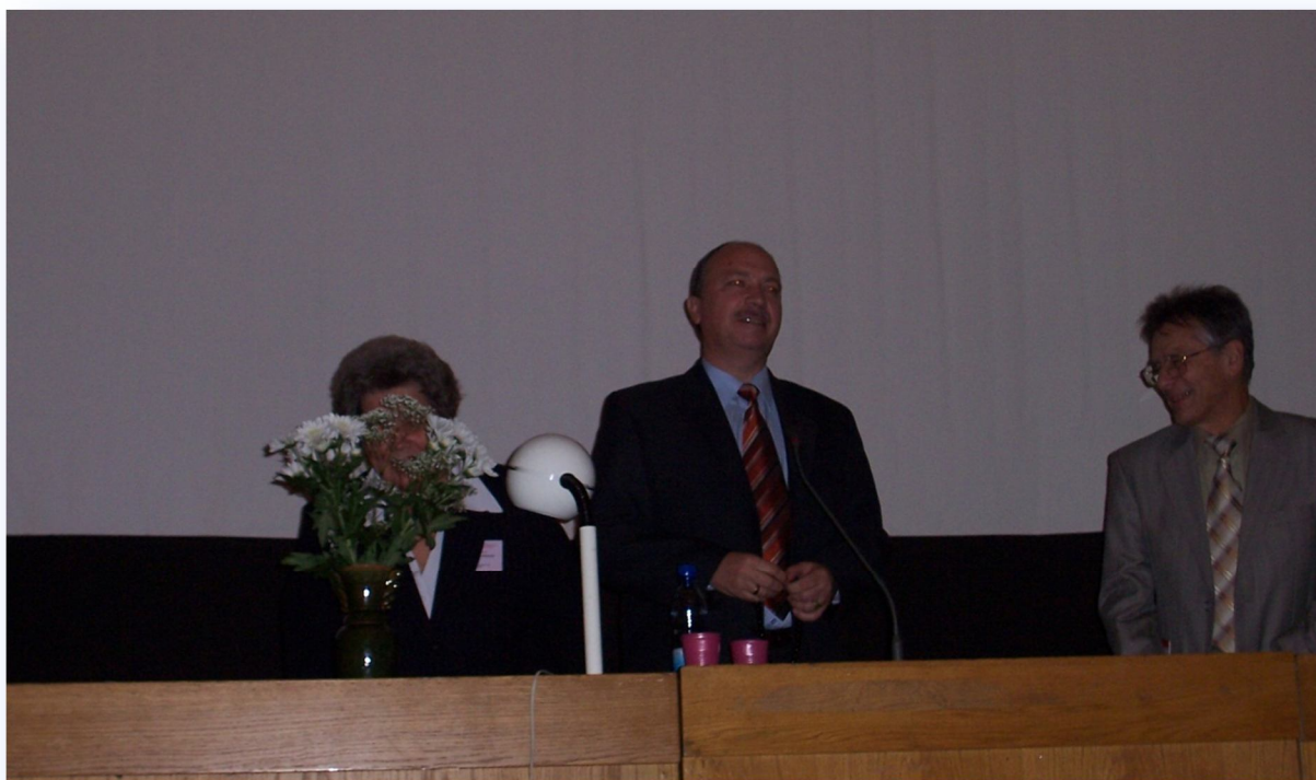
На закрытии международной конференции «Протеолиз, механизмы его регуляции и роль в физиологии и патологии клетки»: международная конференция, Минск, 25-26 октября 2007 г.