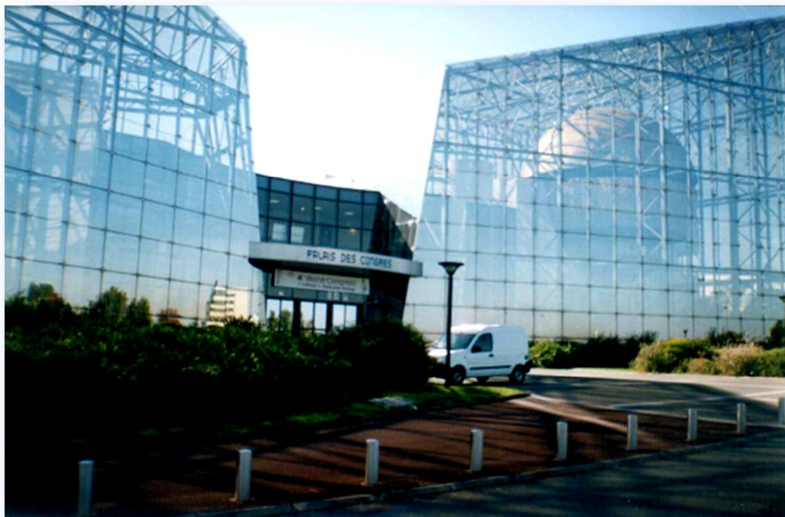
Конгресс Палас (Palais) в предместье Пуатье (Poitiers) (Франция), октябрь 2005 г.