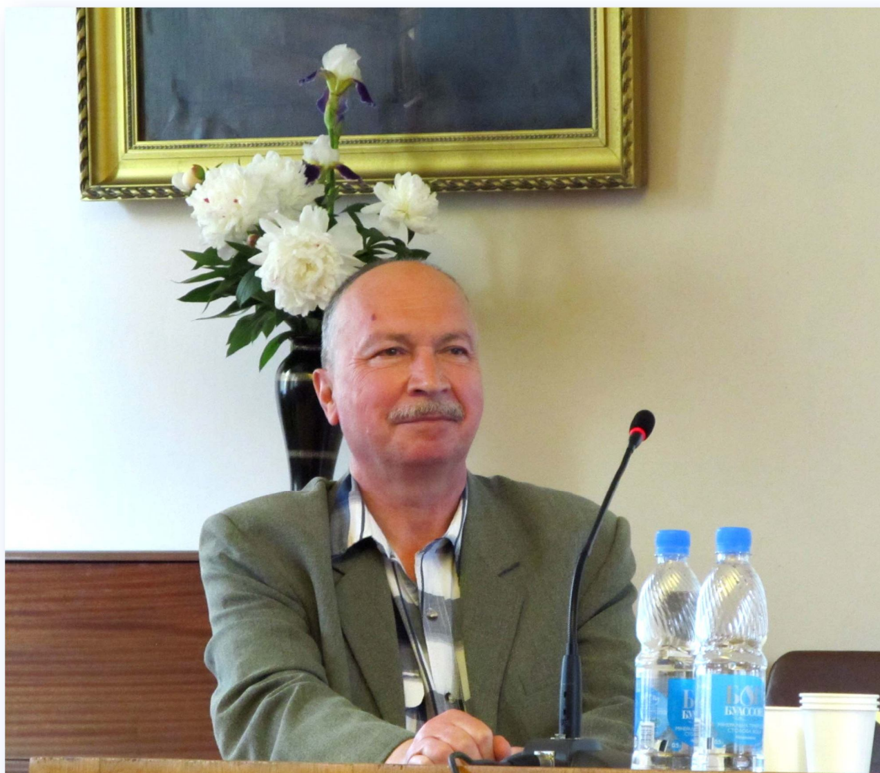
Секционное заседание Конференции-конкурса молодых ученых «Актуальные проблемы биохимии и биотехнологии - 2016», май, Киев Институт биохимии им. А.В. Палладина НАН Украины