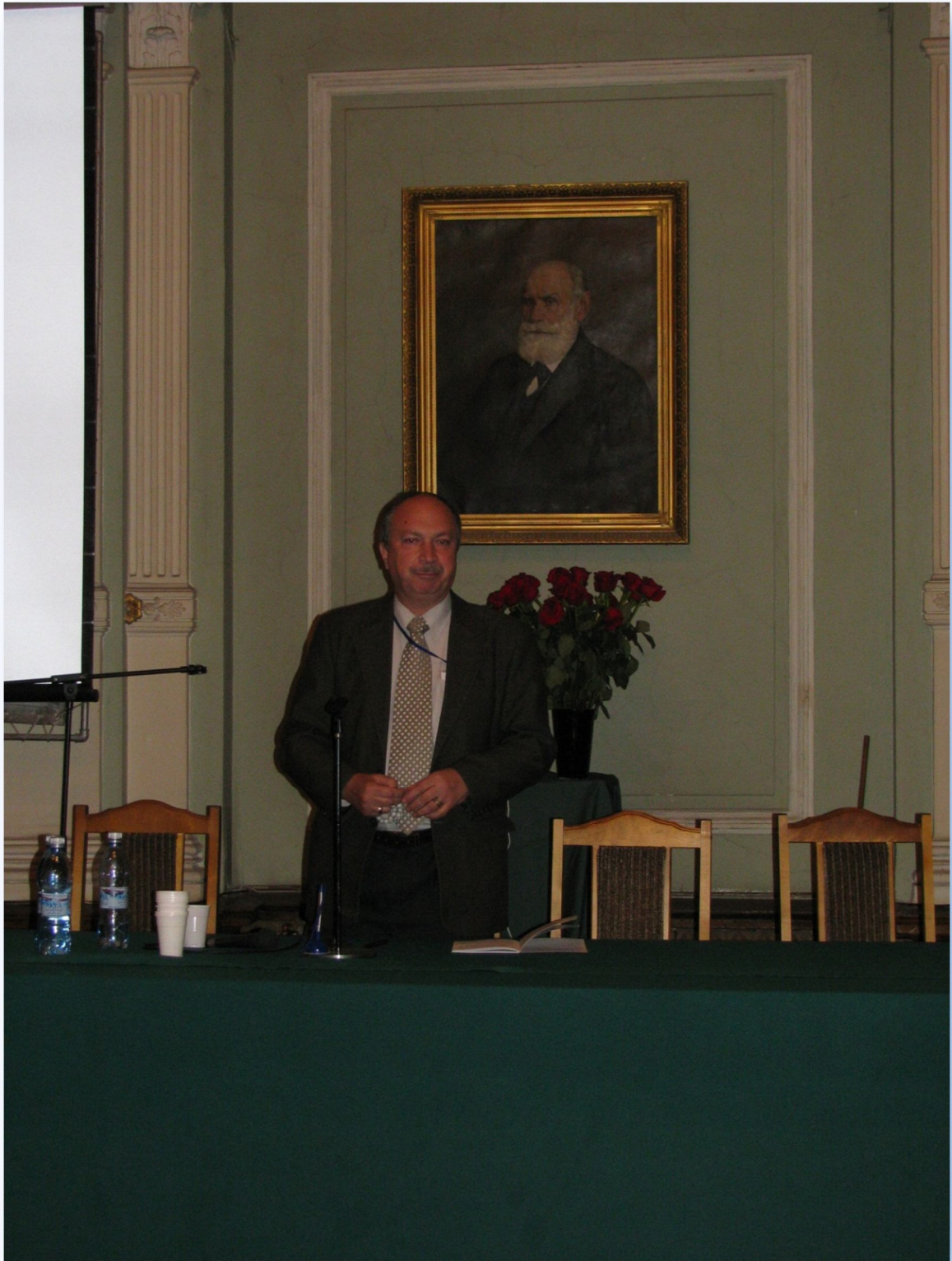
Секционное заседание 1-й международной научно-практической конференции «Высокие технологии, фундаментальные и прикладные исследования в физиологии и медицине», Санкт-Петербург, ноябрь 2010 г.