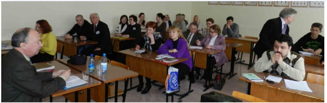
Секционное заседание XIII съезда белорусского общества физиологов «Сигнальные механизмы регуляции физиологических функций», апрель 2012 г., Минск