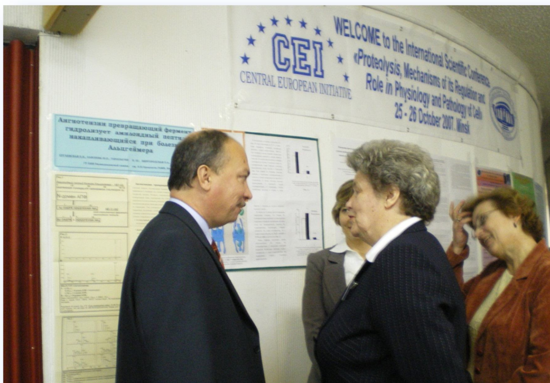
Участники международной конференции, Минск, 25-26 октября 2007 г.