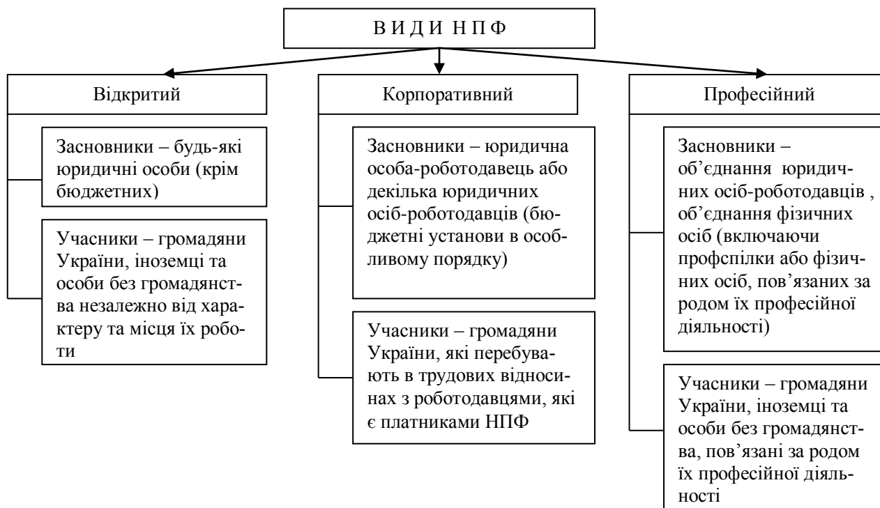
Рис. 1. Види недержавних пенсійних фондів