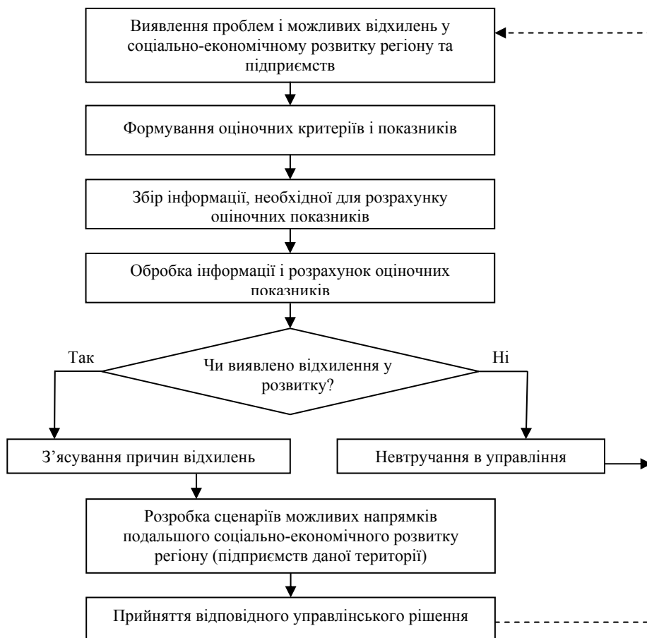
Рис. 2. Схема процесу моніторингу соціально-економічного розвитку регіону та підприємств, розташованих на даній території

Якщо відхилень не виявлено, приймається рішення про невтручання в систему управління соціально-економічним розвитком регіону (підприємства), у протилежному ж випадку з'ясовуються причини цих відхилень; на основі з'ясованих причин відхилень розробляються сценарії можливих напрямків подальшого соціально-економічного розвитку; розглянувши можливі сценарії розвитку, керівництво приймає відповідні управлінські рішення.