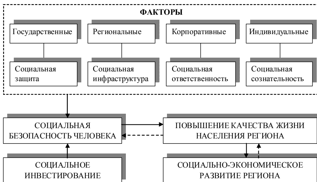
Рис. 1. Взаимосвязь социальной безопасности, социального инвестирования и социально-экономического развития региона

Таким образом, механизм как категория является тем инструментом, который обеспечивает