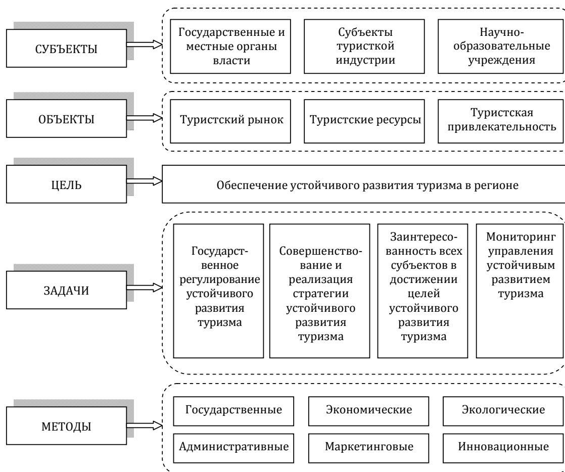
Рис. 3. Механизм управления устойчивым развитием туризма в регионе

Для эффективного управления устойчивым развитием туризма на региональном уровне необходимым видится кластерное сотрудничество органов государственной и местной власти, туристских предприятий и субъектов туристской инфраструктуры, научно-образовательных учреждений. Кластер представляет собой группу взаимосвязанных и взаимодействующих между собой предприятий, организаций и учреждений, целью которых является достижение определенного социально-экономического эффекта, реализующих конкурентные преимущества территории, на которой они функционируют. Схематически механизм управления устойчивым развитием туризма на региональном уровне приведен на рис. 3.