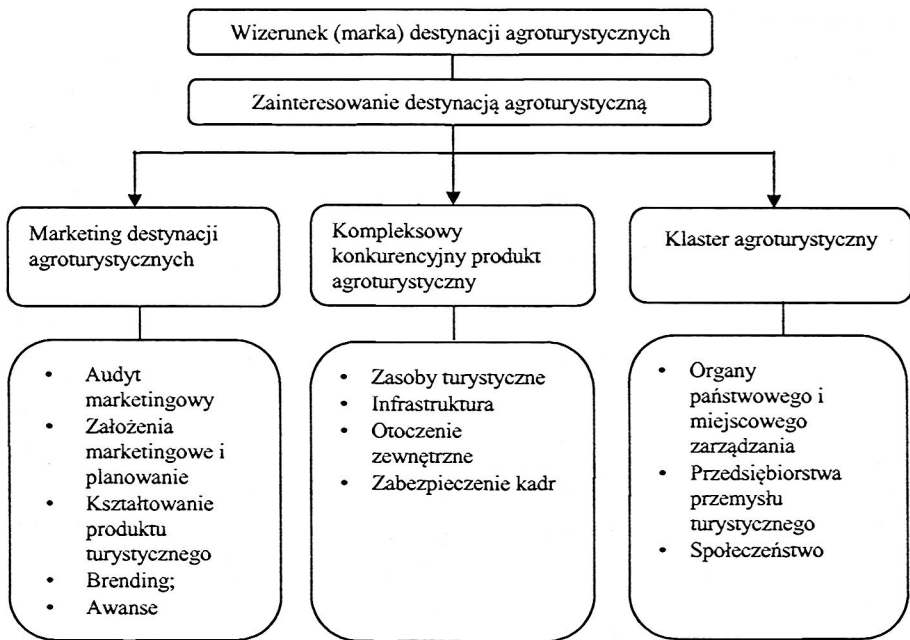
Ryc. 2. Kształtowanie wizerunku i zainteresowania dystancją agroturystyczną

Marketing destynacji agroturystycznych powinien być zawarty w planach strategicznych ze względu na to, że kształtowanie wizerunku (inaczej marki) jest procesem złożonym i długotrwałym. Konceptyjny schemat kształtowania wizerunku destynacji agroturystycznych przedstawiono na ryc. 2.