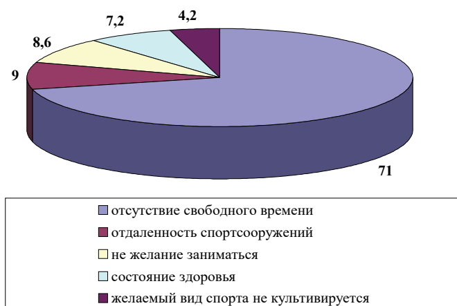
Рис. 1. Факторы, препятствующим систематическим занятиям физическими упражнениями