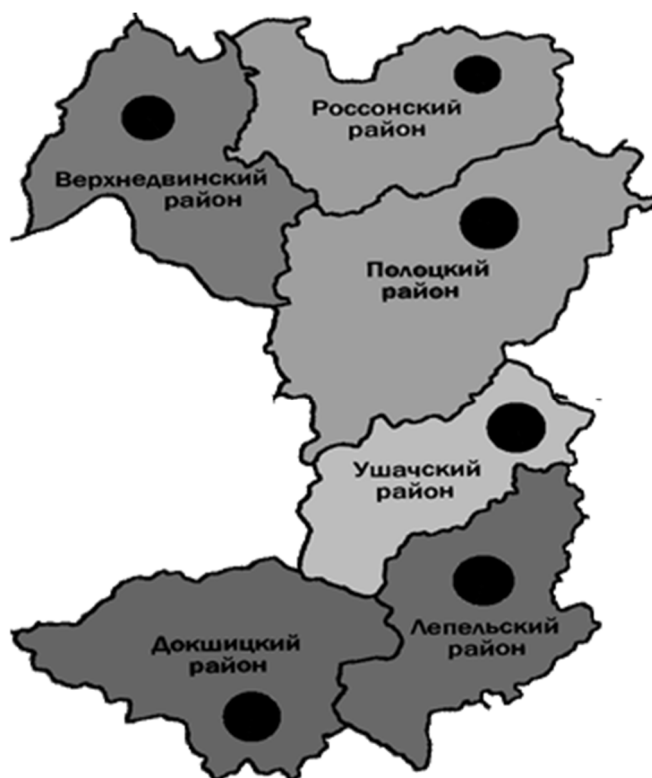
Рисунок 1. – Административные районы Полоцкой культурно-туристской зоны

Полоцкая культурно-туристская зона на северо-западе граничит с Латвией, на севере и северо-востоке – с Российской Федерацией, на юге – с Минской областью, на западе – с Миорским и Глубокским районами Витебской области, являющимися частью туристской зоны «Браславские озера», на востоке – с Витебской культурно-туристской зоной, на юго-востоке – с Оршанско-Копысской культурно-туристской зоной. На территории Верхнедвинского района расположена самая северная точка Республики Беларусь ( 56^{\circ} 10' с.ш.), которая находится недалеко от мемориала «Курган Дружбы».