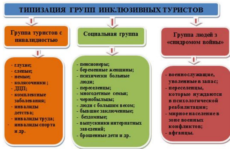
Рисунок 2. – Схема типизации групп инклюзивных туристов в Украине

Выделим следующие факторы, которые ограничивают или влияют на возможность организации инклюзивного туризма в Украине [10, с. 85-95]: