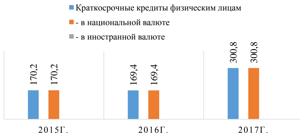
Рисунок 1 – Задолженность по краткосрочным кредитам, выданным банками Республики Беларусь физическим лицам за период 2015–2017 гг., млн. руб.

Основной прирост кредитования за рассматриваемый период приходится на население. За 2017 г. объем розничного кредитования увеличился почти на 27% (рисунок 1, рисунок 2).