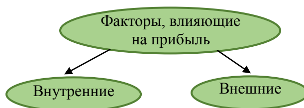
Рисунок 1 – Факторы, влияющие на прибыль

Процесс накопления прибыли происходит под влиянием факторов (рисунок 1).