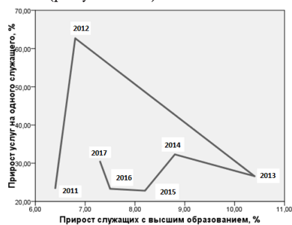
Рисунок 1 – Зависимость прироста услуг на одного служащего от прироста служащих с высшим образованием (2011–2018 гг.)

Как правило, в основе подхода к анализу эффективности использования банками трудовых ресурсов лежит главный показатель эффективности деятельности банка – соотношение активов и прибыли на одного сотрудника банка. При рассмотрении данного измерителя и других показателей для белорусской банковской системы очевидно несоответствие динамики числа служащих с высшим образованием динамике прибыли, активов и объемов банковских услуг, приходящихся на одного банковского служащего. Условия функционирования банковской системы в современной экономике подвергались изменениям, однако вложения в высшее профессиональное образование должны обладать некоторой отдачей. Она необходима для подтверждения эффективности, целесообразности привлечения к банковской деятельности более образованных кадров. Например, за период 2011–2018 гг. линейное возрастание доли служащих банков с высшим образованием не привело к аналогичным изменениям рассматриваемых показателей деятельности банков (рисунки 1–3).