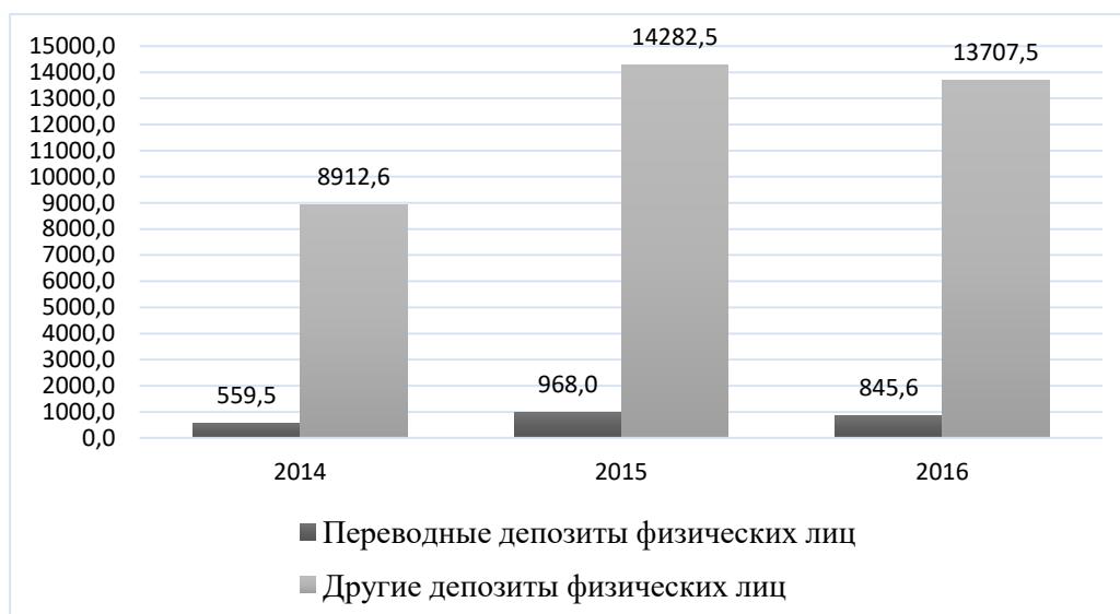
Рисунок 2 –Динамика депозитов физических лиц в иностранной валюте за 2014-2016 гг., млн. руб. (данные указаны на 01.01. след. года)

Примечание – Источник: собственная разработка на основе [5, с. 76-77, табл. 1.12]