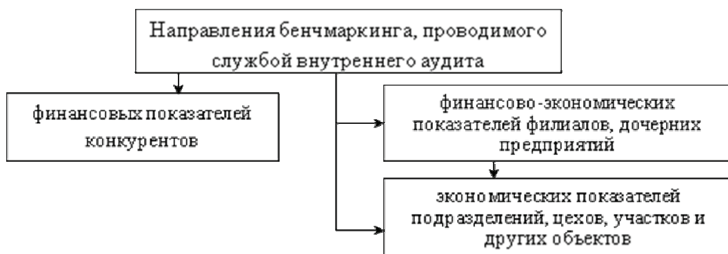
Рис. 2. Направления бенчмаркинга во внутреннем аудите

Функционировать с положительным финансовым результатом еще не означает рост эффективности деятельности организации, а мониторинг конкурентов, изучение и применение передового опыта в управлении, производстве и реализации как нельзя актуальны. Работать вслепую, быть догоняющим — это значит не видеть себя в будущем, так как конкуренты не будут ждать. Все это обуславливает оценку внешней среды и эффективности внутренних бизнес-процессов. Данную задачу призвана решать служба внутреннего аудита. Вначале целесообразно установить направления исследования, которые представлены на рис 2.