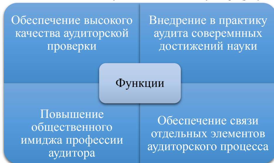
Рисунок 1. Функции международных стандартов аудита

Стандарты занимают важное место в аудите и деятельности аудитора (рисунок 1).