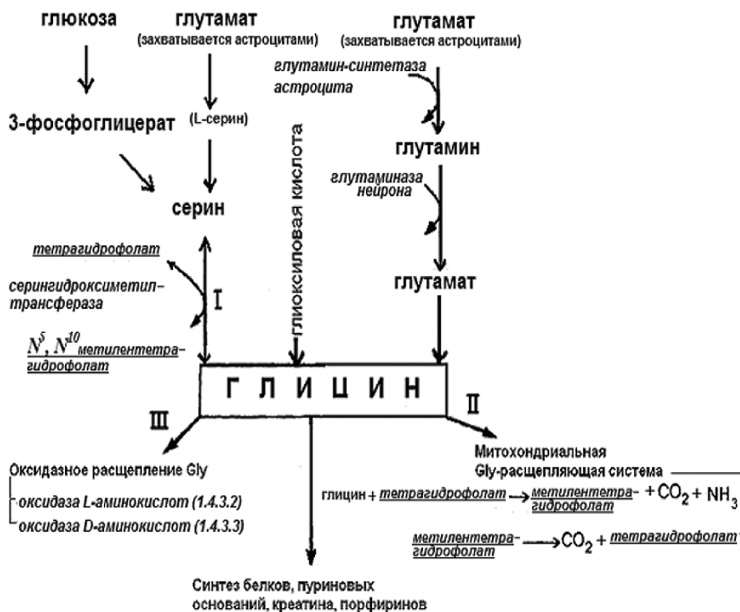
Рисунок 1. Пути метаболизма глицина в нервной ткани. I - взаимопревращения глицина и серина в ходе серингидроксиметил транс-феразной реакции, II - прямое окисление глицина оксидазами, III - расщепление глицина митохондриальной системой. Жирным шрифтом выделены основные интермедиаты, используемые для синтеза глицина, курсив - энзимы, участвующие в метаболизме аминокислоты, подчеркнутый курсив - тетрагидрофолат.

Следовательно, метаболизм Gly включает в себя целый ряд ката- и анаболических процессов, пересекающихся в ряде точек, суммируя которые, можно представить схему метаболизма Gly (рис. 1). Это позволяет одним процессам превалировать над другими. Например, в астроцитах головного