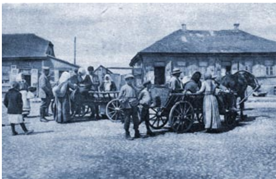
Поліські русини на пінській вулиці. Фотографія орієнтовно 1916 р.

На том лементарі повинні учитися читати всі Полешуки, бо їх мова кришку інша як Українська або Білоруска, так в своїй мові повинні науперш научитися читати, писати, рахувати і Бога хвалити.