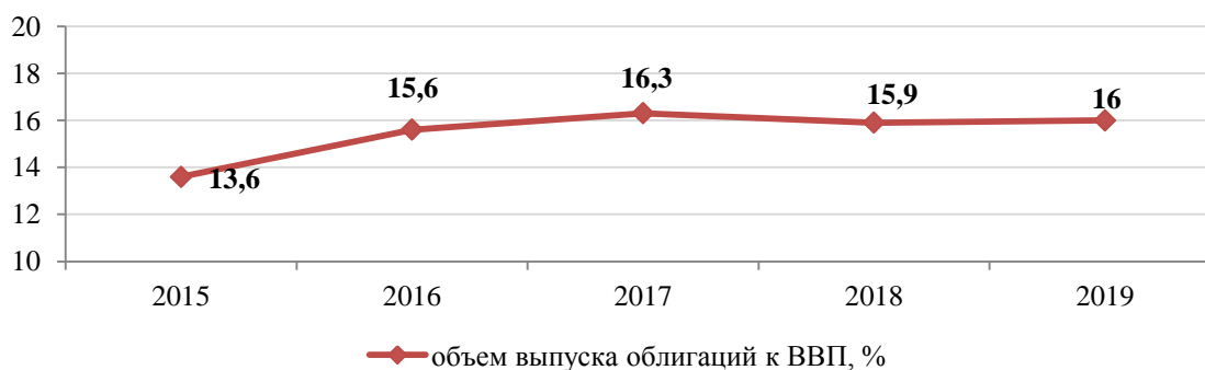
Рисунок 2 – Динамика отношения объема выпуска облигаций к ВВП за 2015-2018 гг., процентов [2]

Отношение объема рынка облигаций Республики Беларусь к валовому внутреннему продукту выросло с 13,6% в 2014 г. до 16,0% на начало 2019 г. (рисунок 2).