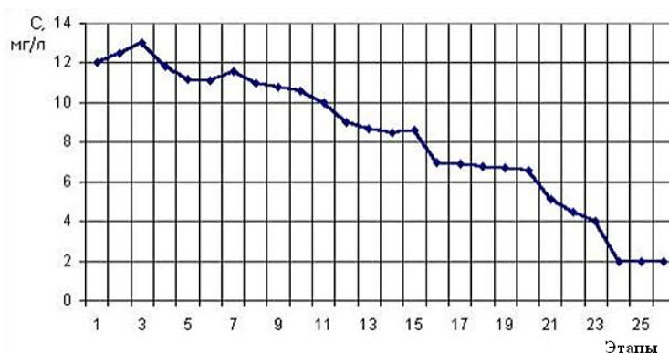
Рисунок 2 – Этапы итерационной корректировки значений учебной выборки (C – показатель качества водоочистки согласно параметра «взвеси»)