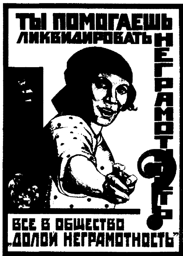
Плакат 1925 года.