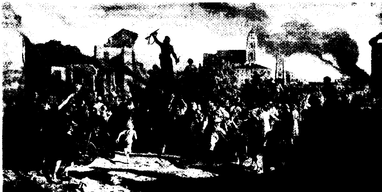
Валянцін Волкаў. "Мінск. 3 ліпеня 1944 года".

15. Вызначыце, якім гістарычным падзеям прысвечаны плакаты, а таксама адзначце адносіны аўтараў-мастакоў да гэтых гістарычных падзей.