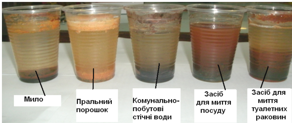
Рис. 2. Результати електрохімічної деструкції забруднювачів у водних розчинах

води піддались електрохімічній деструкції лише частково, що було встановлено після відстоювання зразків протягом 2 годин – між прошарками, що флотували та осіли залишився однорідний кольоровий прошарок (середина стакану), який не змінив свого забарвлення та однорідності і після дводобового відстоювання. Повна стратифікації водних розчинів відбувалась або протягом кількох діб – у тому числі під дією окислювальної здатності атмосферного повітря (рис. 3).