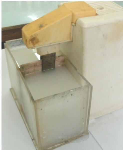
Рис. 1. Зовнішній вигляд електролізної установки дослідження впливу миючих речовин на ефективність електролізної деструкції забруднювачів води

У якості забруднювачів використали: мило, пральний порошок, засіб для миття посуду, засіб для миття туалетних раковин, комунально-побутові стічні води. Концентрації всіх забруднювачів становили – 0,2 мг/л. Склад комунально-побутових стічних вод не встановлювався, оскільки завдання повної їх очистки не ставилось.