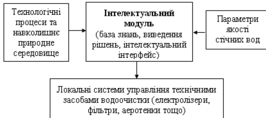
Рис. 2. Архітектура системи управління комплексними методами водоочистки стічними водами промисловими об'єктами (з інтелектуальним модулем)

енергоефективних та екологічно безпечних значень керуючих впливів: густина струму, об'єм кисню, доза реагенту тощо.