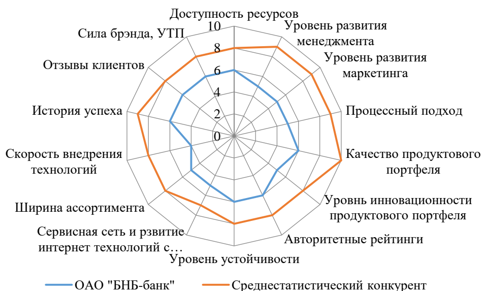
Рисунок 2 – Многоугольник конкурентоспособности

Исходя из проведенного анализа экспертизы и компетенций банка и анализа рынка, выделили среднестатистический профиль конкурента (крупные банки Республики Беларусь) и провели анализ конкурентоспособности ОАО «БНБ-банк» по ключевым факторам успеха в отрасли (рисунок 2).