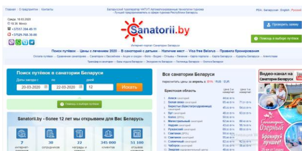
Рисунок 1. – Интернет-портал Sanatorii.by

1. Интернет-портал Sanatorii.by, где представлена информация о всех санаториях Беларуси (более 100 санаторно-курортных организаций) с их подробным описанием, фотографиями и видео (Рисунок 1).