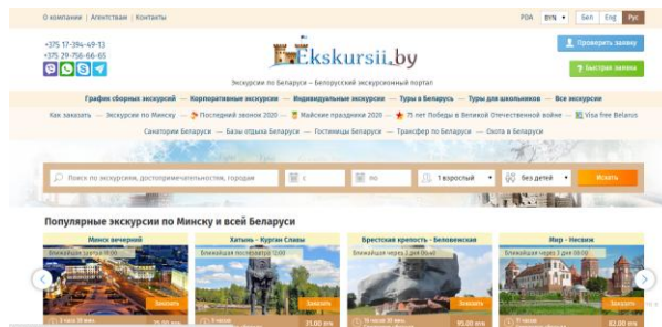
Рисунок 4. – Интернет-портал Ekskursii.by

4. Интернет-портал Ekskursii.by имеет перечень разнообразных по тематике и продолжительности экскурсионных маршрутов по всей Беларуси (более 200 экскурсий) для индивидуальных туристов и корпоративных групп (Рисунок 4).