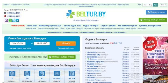
Рисунок 2. – Интернет-портал BelTur.by

2. Интернет-портал BelTur.by, посвященному отдыху в Беларуси, отражает информацию обо всех базах отдыха, туристических комплексах, домах охотника и кемпингах (более 200 объектов отдыха), расположенных в Национальных парках и заказниках (Рисунок 2).