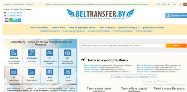
Рисунок 5. – Интернет-портал BelTransfer.by

5. Интернет-портал BelTransfer.by предлагаем услуги по организации трансфера между всеми городами в пределах страны (Рисунок 5).