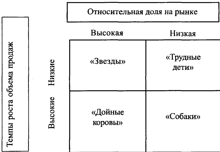
Рис. 1. Матрица «Бостон-Консалтинг групп»