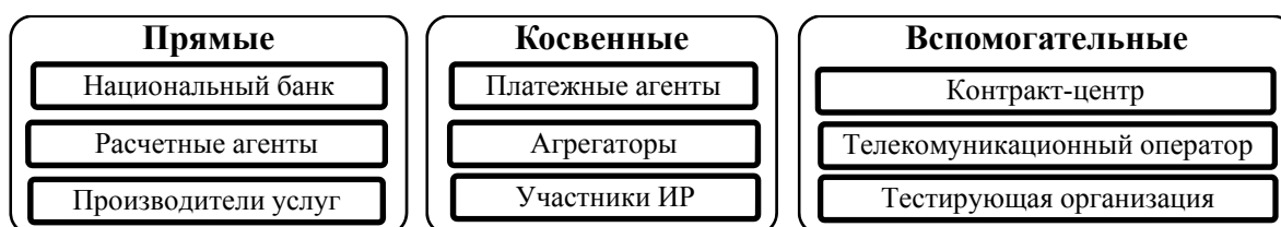
Рис. 1. Структура системы ЕРИП.

На сегодняшний день ЕРИП представляет собой совокупность единых правил и процедур, определяющих порядок осуществления платежей за услуги и платежей в бюджет с использованием платежных инструментов, предусмотренных законодательством. Участники системы ЕРИП формируют ее институциональную структуру с определенными в соответствии с нормативно-правовой базой полномочиями, компетенциями и ответственностью (рис. 1).