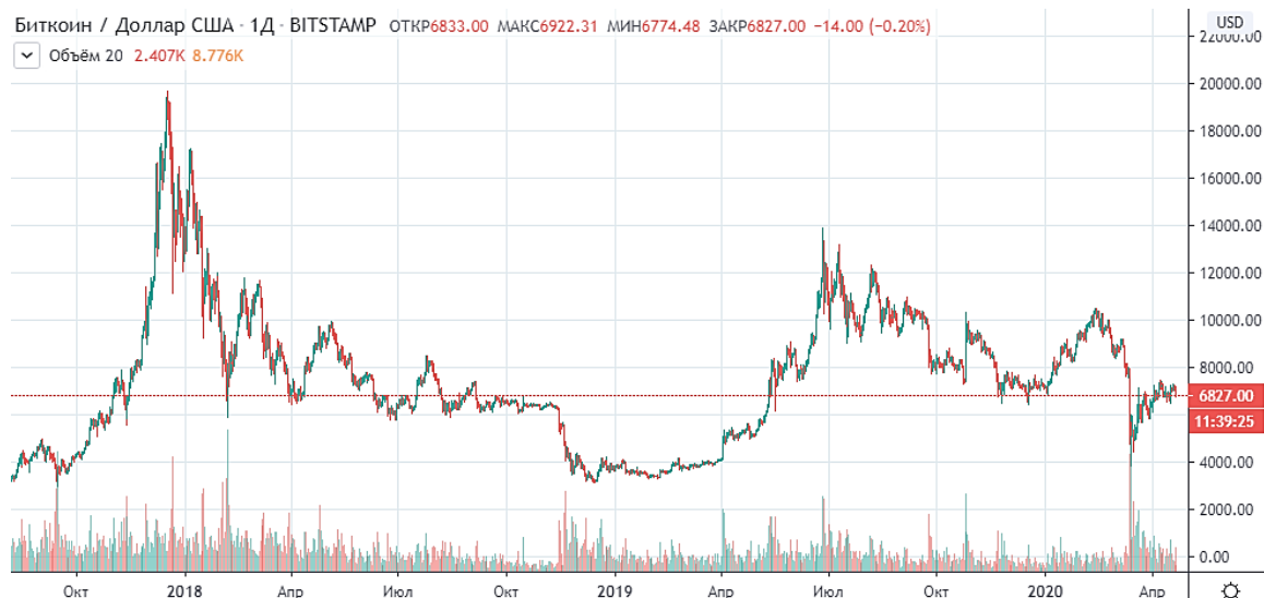
Рисунок 1 – Анализ Биткоина в долл. США