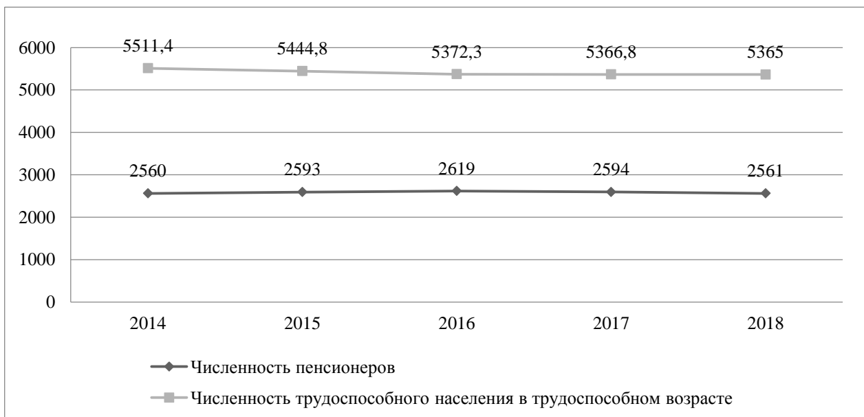
Рис. 1. Соотношение численности населения в трудоспособном возрасте и пенсионеров в Республике Беларусь за период 2014 -2018 гг., тыс. чел.

Пенсионная система Республики Беларусь основывается на принципах солидарности, т. е. за счёт текущих взносов работников формируются текущие пенсионные выплаты. Характерным признаком распределительной системы является её зависимость от демографических факторов – соотношения численности трудового населения и пенсионеров (рисунок 1).