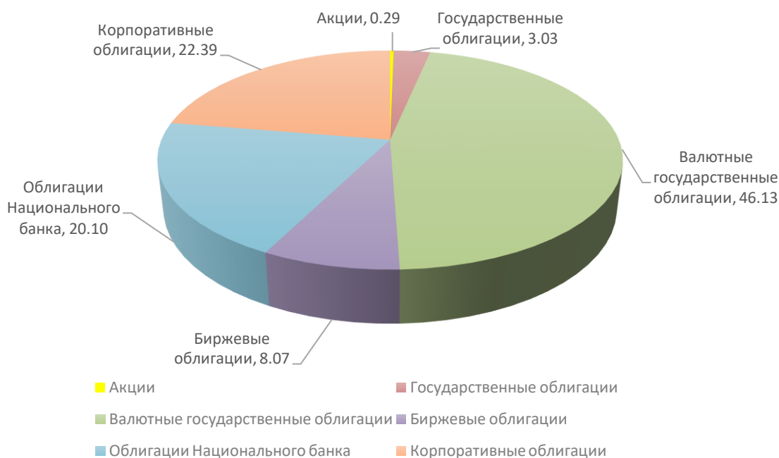
Рисунок 1 - Структура участников фондового рынка Республики Беларусь в 2019 г.

Примечание. Источник: собственная разработка на основе [3].