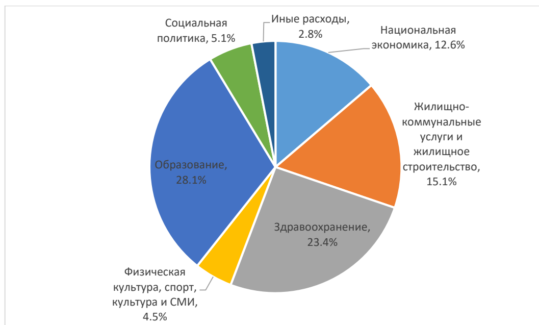
Рисунок 1 – Структура расходов местных бюджетов Республики Беларусь в 2019 году

Структура расходов местных бюджетов Республики Беларусь представлена на рисунке 1.