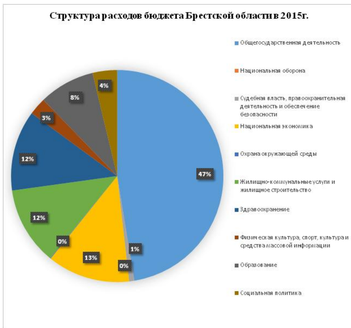
Рисунок 4 – Структура расходов бюджета Брестской области в 2015 г., %