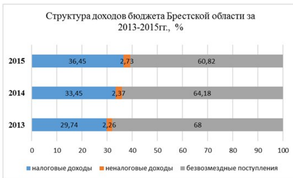
Рисунок 1 – Структура доходов бюджета Брестской области за период 2013-2015гг., %

На рисунке 1 продемонстрировано изменение структуры доходов бюджета Брестской области с 2013 по 2015гг.