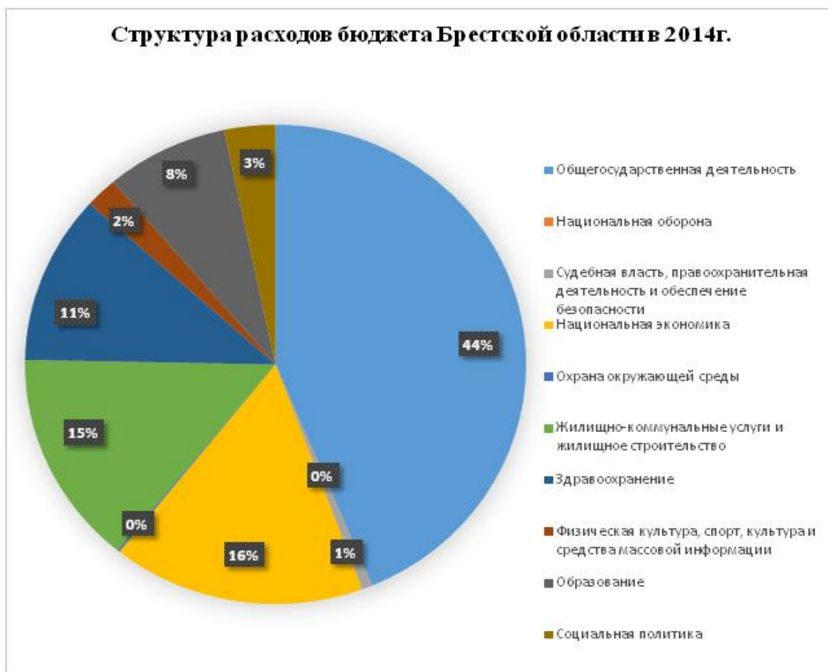
Рисунок 3– Структура расходов бюджета Брестской области в 2014 г., %

Как видно из рисунка 3, наибольшую долю в 2014 году в структуре расходов бюджета Брестской области по-прежнему занимала общегосударственная деятельность – 44% и национальная экономика – 16%. Расходы на здравоохранение составили 11%, на образование – 8%, жилищно-коммунальные услуги и жилищное строительство – 15% общей суммы расходов бюджета. При формировании бюджета полностью обеспечены, исходя из макроэкономических показателей, расходы на оплату труда работников бюджетных организаций, трансферты населению, оплату коммунальных услуг, продуктов питания, медикаментов.