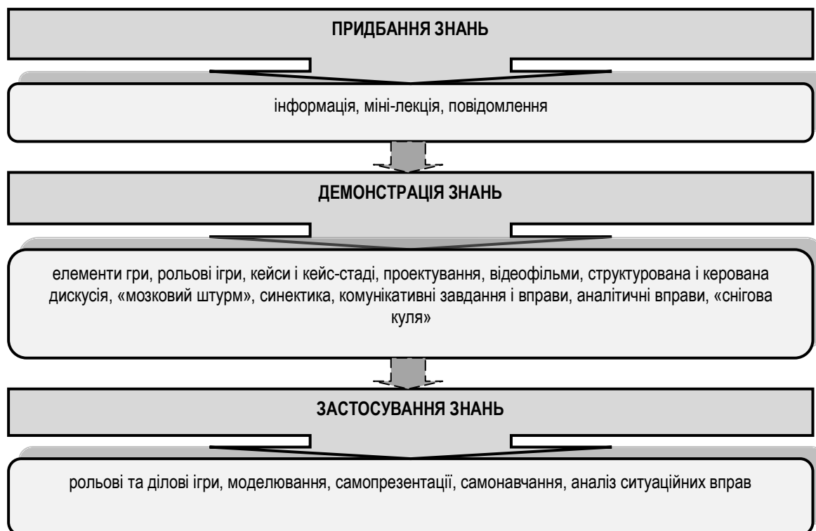
Рис. Трирівнева модель навчання (розроблено автором на основі [16, с. 57])

Зазвичай на тренінгу використовується трирівнева модель навчання: придбання → демонстрація → застосування (рис.).